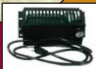
Ventilateur / Blower

Grande chambre à combustion / Large firebox