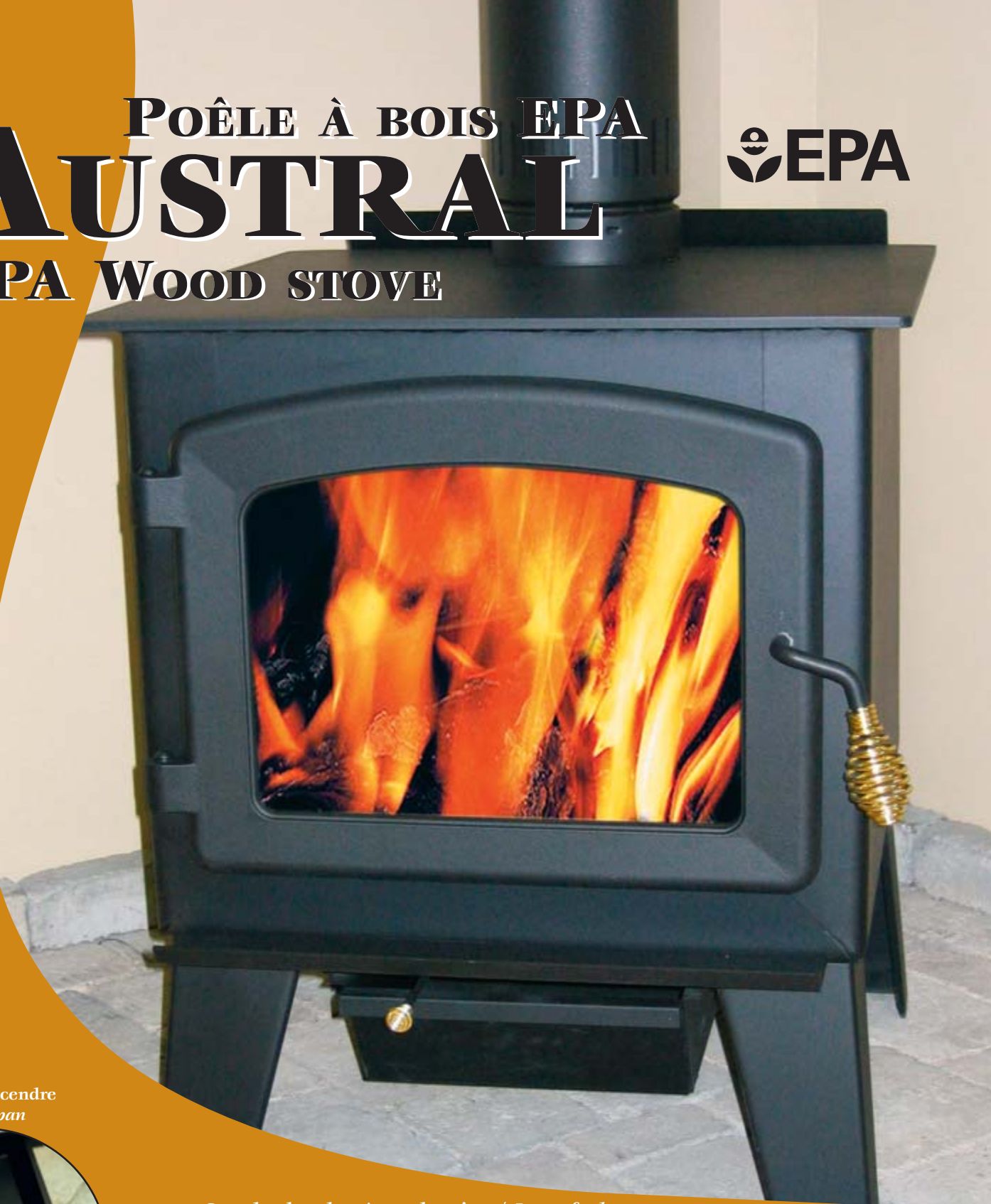
Tiroir à cendre Ash pan