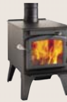
EASTWOOD 1900 DB03170